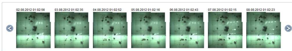
Image Telemetry data